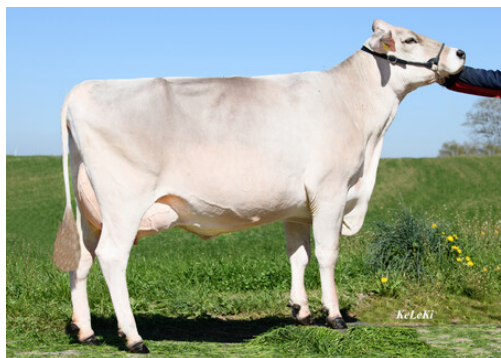
Wilho's Arif JEWINA