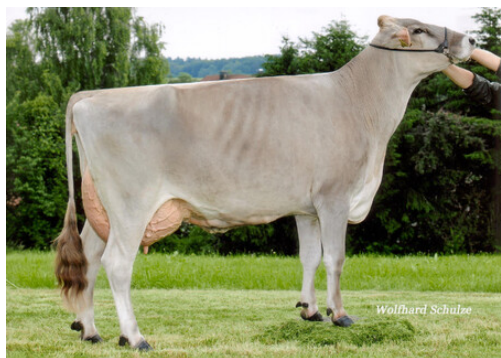
MMM: Vigor NORIS