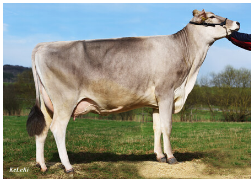
M: Vanpari NOUGAT

V: GS Amor ARISTO M: Vanpari NOUGAT 1L / G+84 Ø1L: 7'294 kg 5.33 % 4.11 % LL: 16'889 kg 5.39 % 4.13 % MM: Paysli NICKI 1L / VG85 Ø6L: 6'297 kg 5.05 % 3.77 % LL: 40'092 kg 5.07 % 3.78 % MMM: Vigor NORIS 5L / VG89 Ø7L: 8'416 kg 5.01 % 3.87 % LL: 58'914 kg 5.01 % 3.87 %