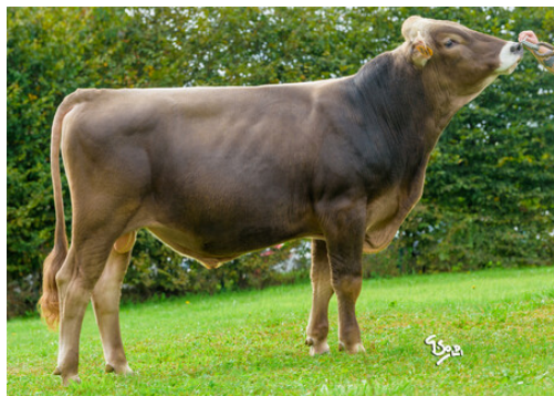
SYR Aristo ARIF-ET